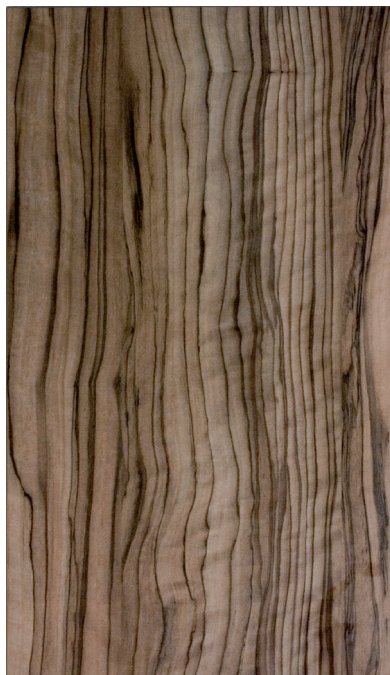
Nantes 4c Olivo